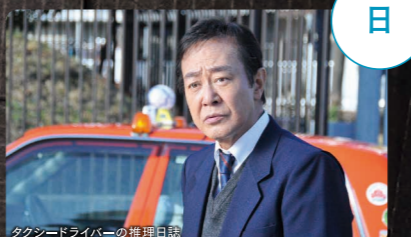
ザ・プレミアムステージ 夜9:00~11:00