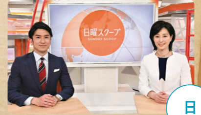
BS朝日 日曜スクープ 夜7:00~8:54 生放送 司会:上山千穂 (テレビ朝日アナウンサー) / 菅原知弘 (テレビ朝日アナウンサー)