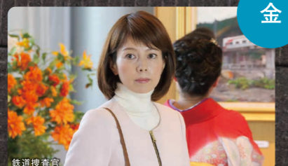
金曜プレミアム 夜9:00~9:54 / 夜10:00~11:00