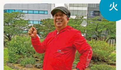
住友生命Vitality presents バナマン日村が歩く! ウォーキングのひむ太郎 夜10:30~11:00 出演:日村勇紀 (バナマン)