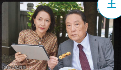
BS土曜ワイド劇場 夜9:00~10:54