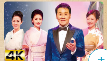
人生、歌がある 夜7:00~8:54 司会:五木ひろし サブ司会:伍代夏子 / 藤あや子 / 坂本冬美