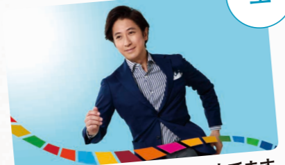
バトンタッチ SDGsはじめてます 夜6:00~6:55 ナビゲーター:谷原章介