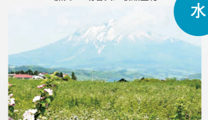
そこに山があるから 夜10:30~10:54 出演:本上まなみ / 早霧せいな