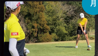
女子ゴルフヘアマッチ選手権 FUTURE QUEEN GOLF MATCH 夜9:00~9:54