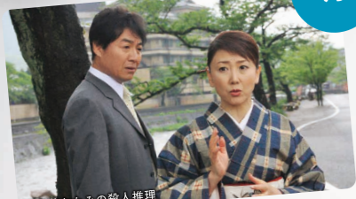
月曜ストーリー 夜6:00~8:00