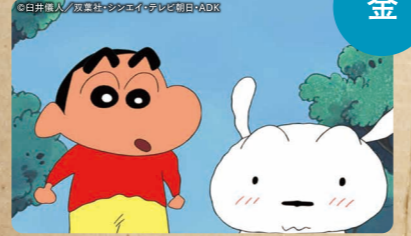
クレヨンしんちゃん 夜7:30~8:00