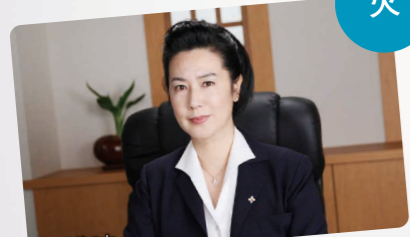
火曜ストーリー 夜6:00~8:00