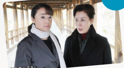
木曜ストーリー 夜6:00~8:00