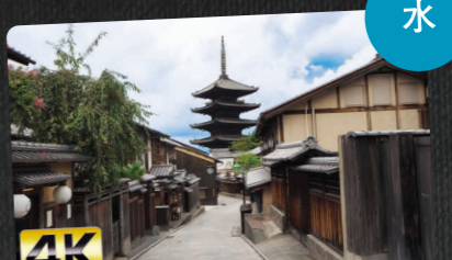
京都ぶらり歴史探訪 夜8:00~8:54 出演:中村雅俊 / 榎 れい / 渡辺 大 / 尾上右近 / 宇梶剛士