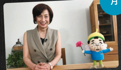
ウチ、"断捨離"しました! 夜8:00~8:54 出演:やましたひでこ 声:平泉 成