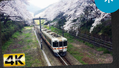
新鉄道・絶景の旅 夜8:00~8:54 ナレーション:林家たい平