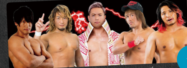
ワールドプロレスリングリターンズ 夜8:00~8:54