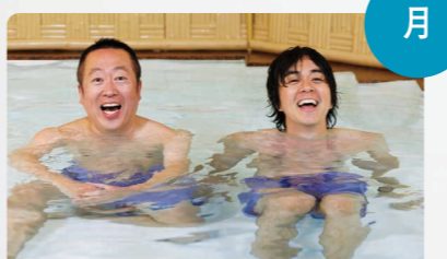
サウナを愛でたい 夜10:30~10:54 出演:ヒヤダイン / 濡れ頭巾ちゃん ナレーション:壇蜜